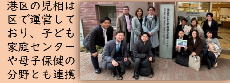
近隣他区の立憲民主党の区議(元職含む)も一緒に。

3/24(月)、港区立の児童相談所(児相)が併設されている港区子ども家庭センターへ。東京23区では政令指定都市などと同様に区が独自で児相を作ることもできますが、目黒区は都立の児相のままで行くことを選択。