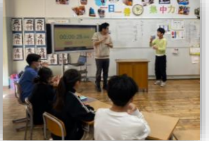
手話を話せぬ健聴者が情報弱者になる場。障害とは何ぞや。

うっかり視察メンバーの集合写真に写り損ねていたようですが、非常に意義のある時間を過ごさせて頂きました。