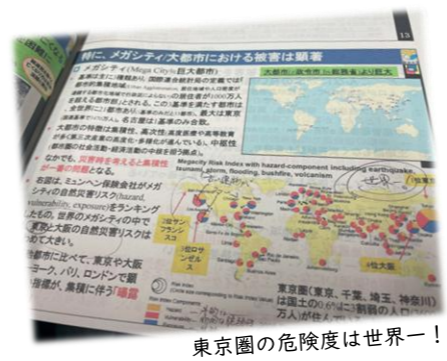
東京圏の危険度は世界一！ていきたいです。

目黒区でも区内で発生した帰宅困難者の収容が可能な場所の確保を進めていますが、そもそも区民が勤務先を含めた外出先で被災した場合の対策は盲点でした。どのような啓発ができるかも含めて、対策を考えていきたいと思います。