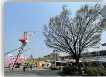
まちづくりには再開発以外の視点も。

(令和11年度までに事業費総額224億円、目黒区単独の財源でも67億円を要するが)実施計画での数値目標は適切か。