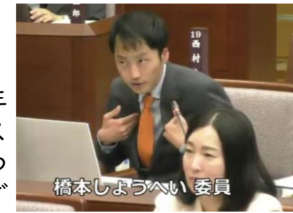
本来の意図に合わせて、意識した部分も。

2/17(月)~3/21(金)に令和7年第1回定例会が開催され、来年度予算や今年度の補正予算のほか、目黒区手話言語条例やハラスメント防止条例など、33の議案を可決しました。ここではいくつかの議案に絞ってご報告していきます。なお、予算特別委員会での質問は裏面に要旨を掲載しています。