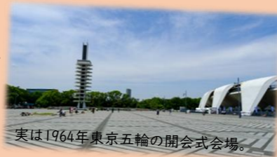
実は1964年東京五輪の開会式会場。

今年11月から東京で開催されるきこえない方(ろう者)の国際スポーツ競技大会催に向け、3/16(日)に区役所大会議室にて啓発イベントが行われました。