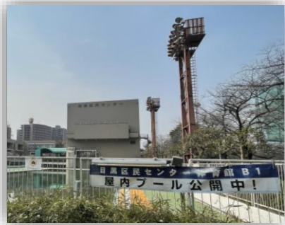
区民センターの件で、区有施設の建替えに膨大な費用が掛かると改めて実感した。

(老朽化が進む区有施設の建替えには膨大な費用をこれから確保する必要があるのに)事業スクラップの金額についての目安はなく、来年度予算のスクラップも7,000万円に留まる。