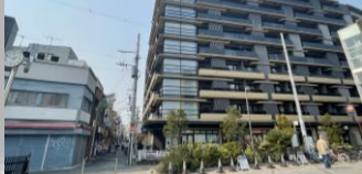
再開発により安全性を一気に高める手法もあるが、調整は大変。

例年、予算を使い切れないのが民間建築物の耐震化。相談をして頂いた方をどのように実際の改修工事や建替えに繋げていくのか。