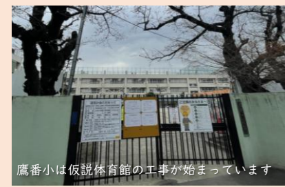
鷹番小は仮設体育館の工事が始まっています

①少なからぬ人数の会計年度任用職員が支えているが、国では「雇用年限廃止」や「常勤化」への動きがある。目黒区ではこのような動きに対してどのように考え、対応しているか。