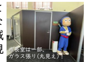
市長室は一部、ガラス張り(丸見え)！

人口規模5万人ほどの氷見市は庁舎の建設費用を抑えるため、廃校になった県立高校の敷地内にあった2つの体育館と旧校舎の一部を新庁舎に転用。北陸地方では体育館のメインアリーナの下にスペースを設けていることが多く、柱や壁のなく広々とした2フロア分の面積を確保できたことも奏功。人口規模の異なる目黒区でそのまま真似るのは厳しそうですし、既存の建物を他用途に転用することが容易ではないということも実感しましたが、柔軟な発想で財政負担が大きく減る例も目の当たりにした視察でした。