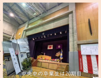
中央中の卒業生は20期目

また、区議会の任期は来年4月まで。残り1年ほどとなりました。再選した補欠選挙からの2年間を振り返りながら、この1年で何を成すか考えておきたいと思っています。