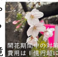
開花期間中の対策費用は1億円超に

もうすぐ桜の季節。目黒川や呑川などの桜の多くは、植えられた時期が昭和40~60年代。