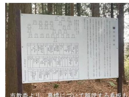
市教委より、墓標について解説する看板も

歴史的な経緯にも敬意を払いつつ、この協定が将来に価値を生むように取組んでいこうと思います。