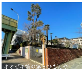
オオゼキ前の第三ひもんや

また、脳性麻痺や小児麻痺のお子さんを受入れた経験もある事業者。障害への理解についてもひと安心。人気の園になるかも知れません。