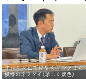
オレンジ色ではなくサンクさん模様のネクタイ(珍しく紫色)

また富山県庁では、民間企業との連携の在り方についてのヒントを得てきました。東京以外のほとんどの自治体では既に右肩下がり財源となっていますが、富山県ではその中で「いかに住民のWell-beingを最大