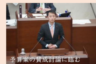
予算案の賛成討論に臨む

2/17(火)に目黒区議会第1回定例会がスタート。今年は議案や陳情の本数も多く、昨年や一昨年よりも少し準備が大変だと感じました(急な解散・総選挙の疲れも一因かもしれません)。