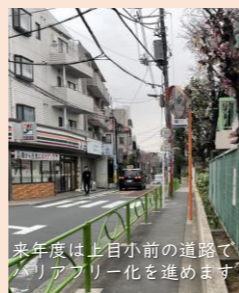
来年度は上目小前の道路でバリアフリー化を進めます

調査・分析のための費用が予算案に見当たらないが、どのような頻度で行なっているか。