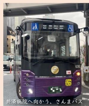
共済病院へ向かう、さんまバス

①地域交通の支援は北部地区でも施行導入する計画があるが、収支比率や利用率といった指標はさんまバスと同様に設けるのか。