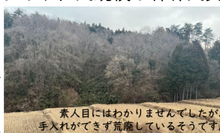
素人目にはわかりませんでした。手入れができて荒廃しているそうです。

協定書に記載されている目黒区のカーボンオフセット以外に、生産された木材がどのように活かせるのかも尋ねました。しばらく人が入っておらず、大規模な森林火災が数年前に起きたこともあり、木材の清算以前にまずは調査が必要とのこと。