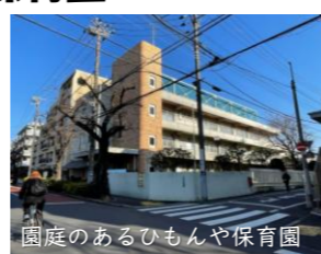
園庭のあるひもんや保育園

1/14(水)文教・子ども委員会の報告はひもんや・第三ひもんや保育園の民営化後の運営事業者について。公募で選ばれたのは埼玉県本庄市の事業者さんでした。