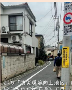
都の「防災環境向上地区」に指定された祐天寺1丁目。

③パンフレットが届いただけでは耐震診断や改修、建替えには至りにくいと考え。職員が足を使って地域住民との連携を図る機会を作れないか。