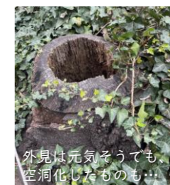
外見は元気そうでも空洞化したもの

前年度までの積み残しも含めると、目黒川緑地で10本、呑川本流緑道で54本など、伐採が必要な桜は区内で合計85本。伐採された後に根が取除きやすくなる(抜根)まで1~2年。植替えた桜が育つにもしばらくかかりますが、後世に目黒区を訪れた方の目を楽しませるよう、大きく育てて欲しいです。