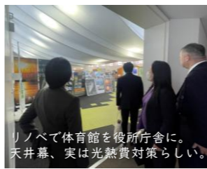
リノベで体育館を役所庁舎に。天井幕、実は光熱費対策らしい。

人口規模5万人ほどの氷見市は庁舎の建設費用を抑えるため、廃校になった県立高校の敷地内にあった2つの体育館と旧校舎の一部を新庁舎に転用。北陸地方では体育館のメインアリーナの下にスペースを設けていることが多く、柱や壁のなく広々とした2フロア分の面積を確保できたことも奏功。人口規模の異なる目黒区でそのまま真似るのは厳しそうですし、既存の建物を他用途に転用することが容易ではないということも実感しましたが、柔軟な発想で財政負担が大きく減る例も目の当たりにした視察でした。